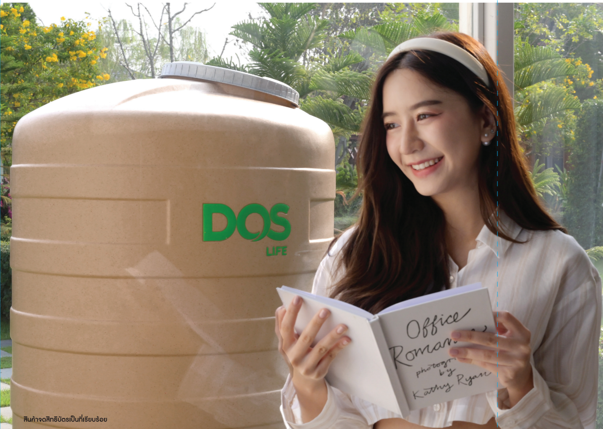
สินค้าจดทะเบียนเป็นที่ยอมรับ