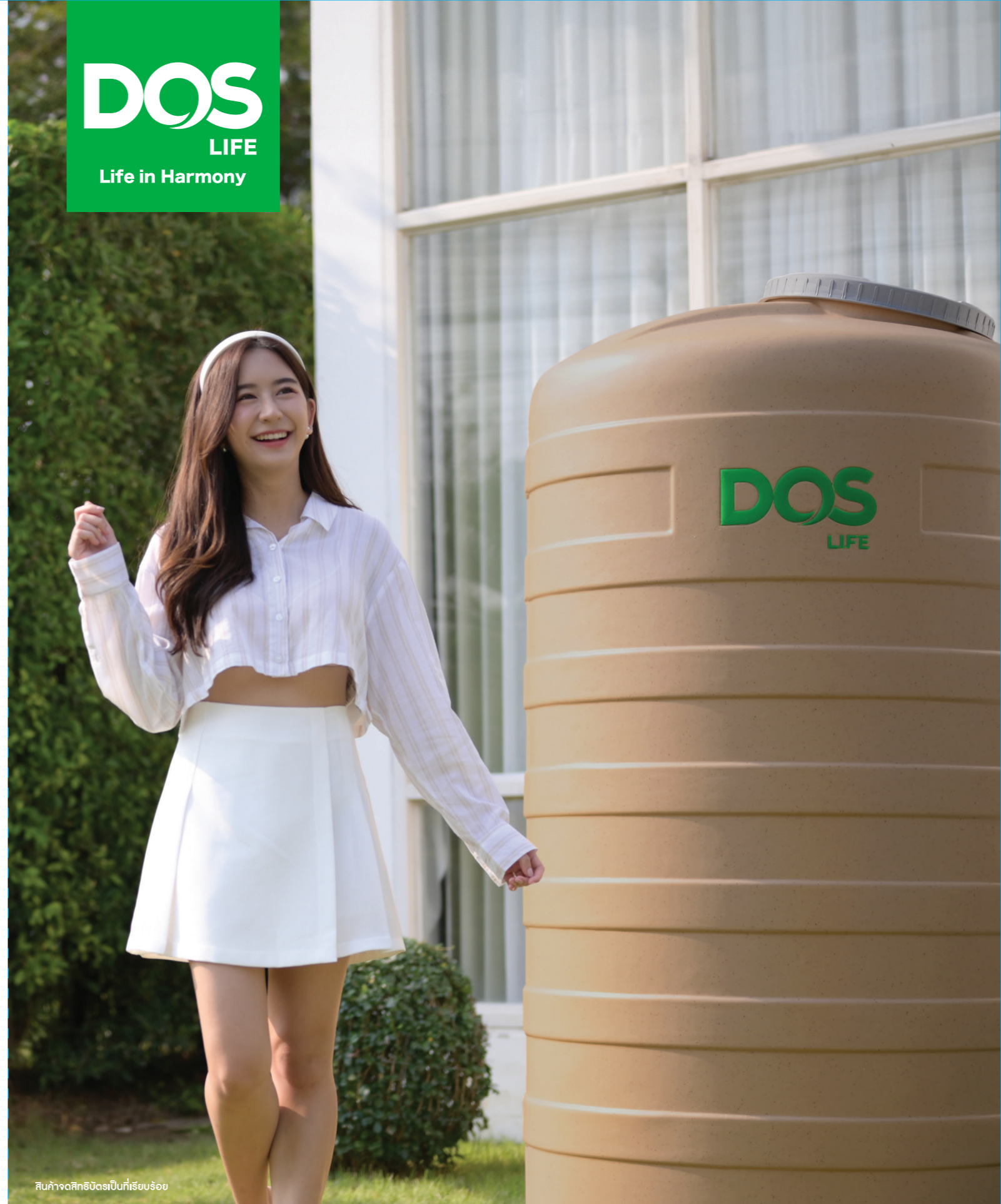
สินค้าจดทะเบียนที่เรียบร้อย

www.dos.co.th doslife @doslife doslifebrand doslife doslifebrand