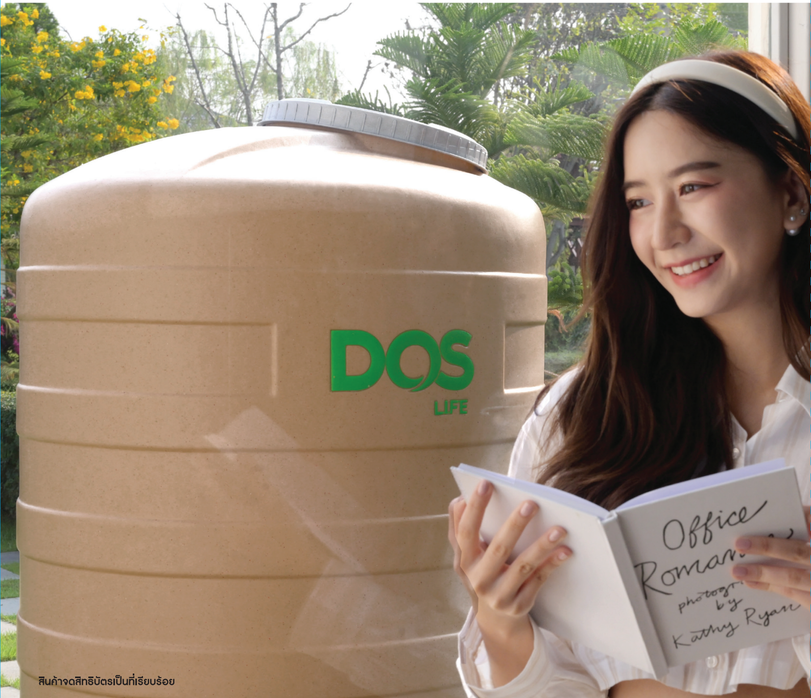
สินค้าจาดสิทริบิตริเป็นทีรียบร้อย

ที่สุด ของความแข็งแรง ทนทาน ยืดหยุ่นสูง ด้วยนวัตกรรม