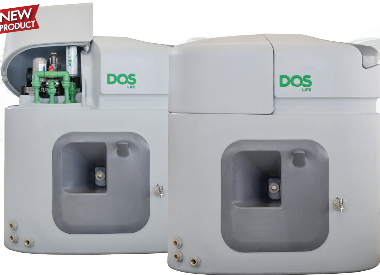
● Cloudy Gray