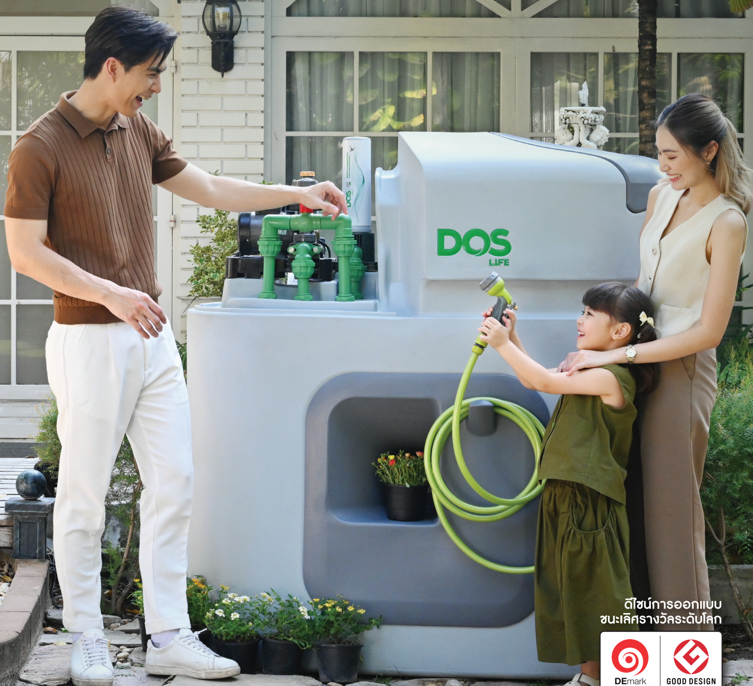
ภาพเพื่อใช้ในการโฆษณาเท่านั้น